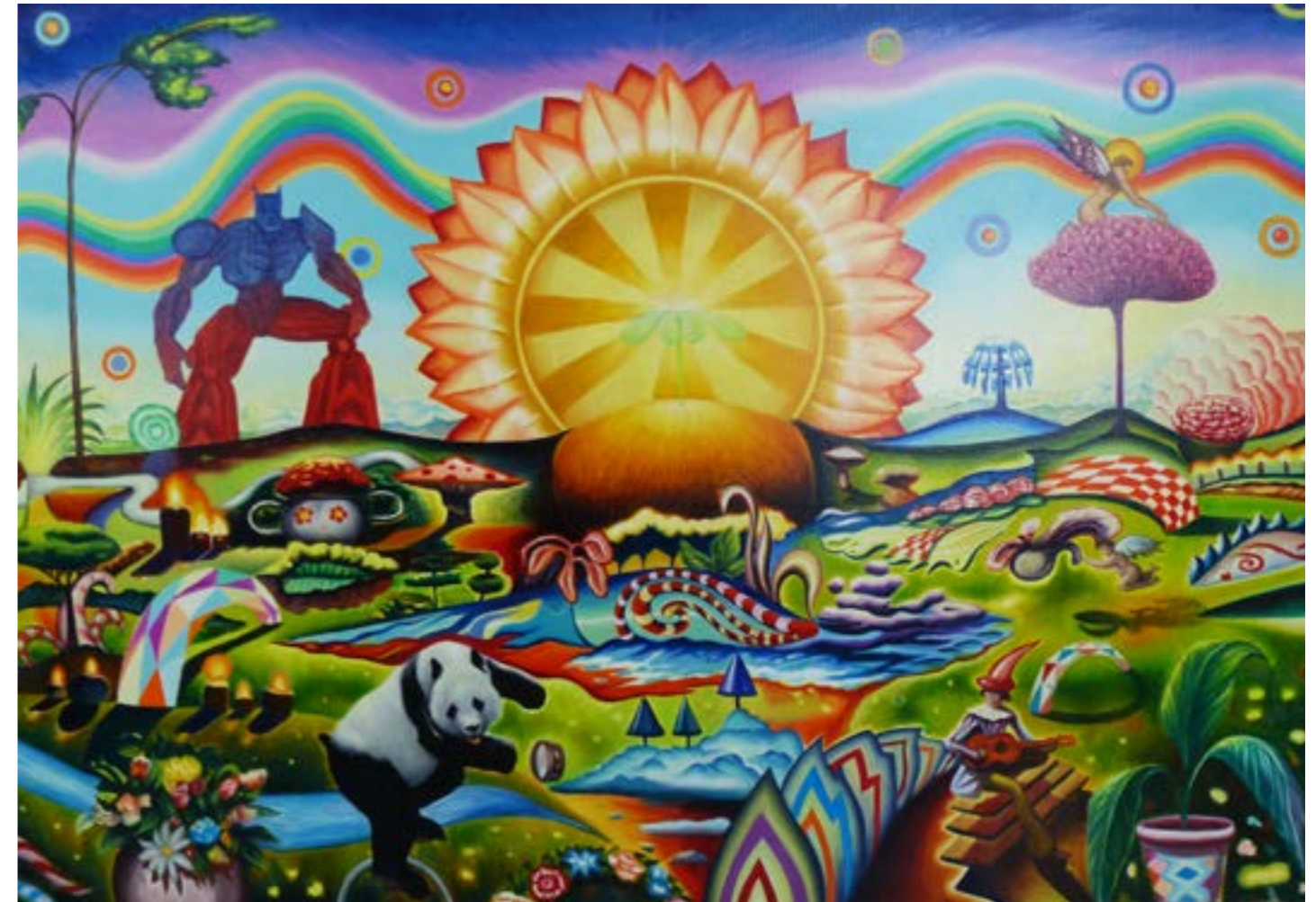
Annunciazione , huile sur toile, 130 x 90 cm, 2019

Follower of syncretism, his flamboyant work revives the European Renaissance. In the right line of Italian humanist philosophers such as Pico della Mirandola, or Marsilio Ficino, his work merges, with humor and fantasy, doctrines, religions, beliefs and knowledge, which seem incompatible at first, but find a balance that gives it a wealth and new knowledge.