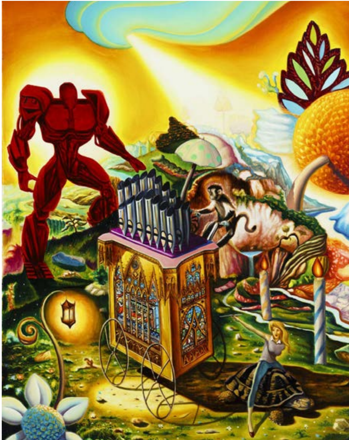
Aurora , huile sur toile, 100 x 70 cm, 2019