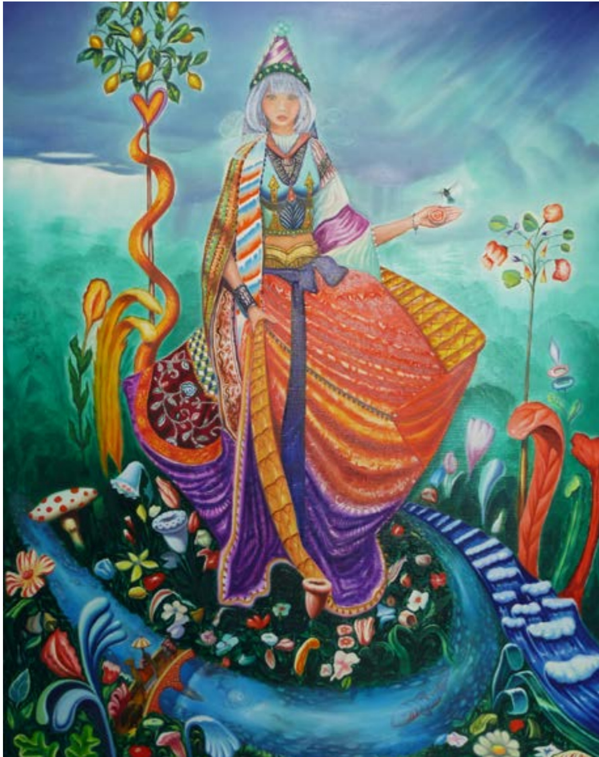
Déesse de la nature , huile sur toile, 90 x 116 cm, 2020