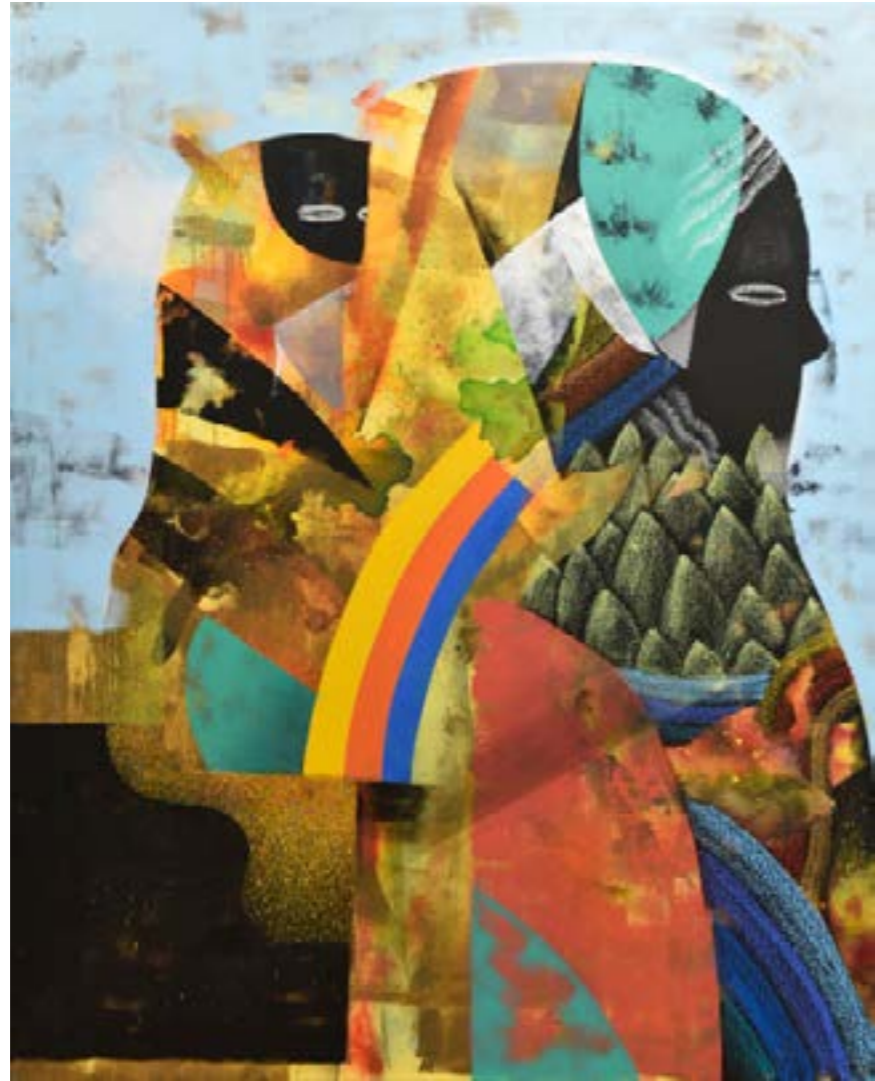
La Femme à l'enfant , technique mixte, 146 x 114 cm, 2018 - 2019