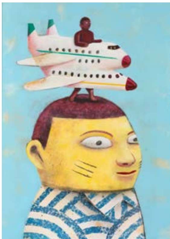
Air Futura , acrylique et spray sur panneau de bois, 50 x 70 cm, 2019