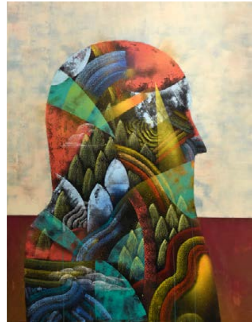
Paysages Interieur , technique mixte, 146 x 114 cm, 2018 - 2019